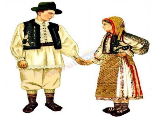
Costume Populare Românești, [41] Regiune: BANAT. Zona: IMIȘ (Lunca Timișului)